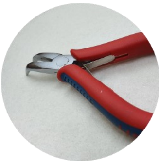
Platbektang *gekromd *gekromd is niet noodzakelijk wel makkelijk