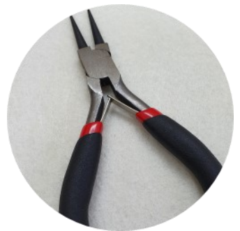
Rondbektang (niet te grof!)